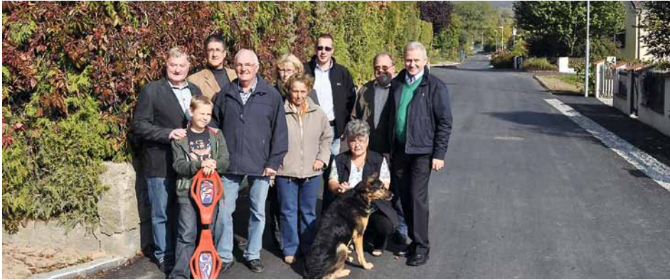
Neue Fahrbahn, neue Nebenflächen, neue Beleuchtung