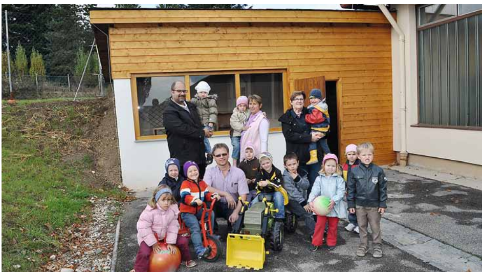
Das neue Gartenhaus findet großen Anklang bei den Kindergartenkindern.

Das Gartenhaus im Kindergarten Schiltern wurde in den letzten Monaten in Zusammenarbeit mit dem Elternbeirat saniert. „Es freut mich, dass die Eltern in ihrer Freizeit tatkräftig mithelfen um dieses Projekt in