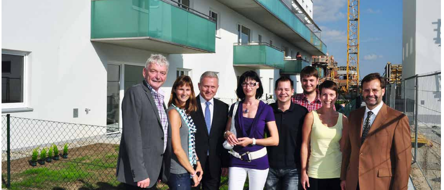
Der Präsident des NÖ Landtages Ing. Hans Penz war Ehrengast bei der Schlüsselübergabe in der Langen Sonne.

Das neue Wohnhaus der Kirchberger Wohnungsgenossenschaft in der Langen Sonne wurde Ende September der Bestimmung übergeben. Die angrenzenden noch in Bau befindlichen Objekte werden im Mai bzw. Oktober 2012 fertig gestellt. Ein Ende der regen Bautätigkeit im Siedlungsgebiet „Lange Sonne“ ist