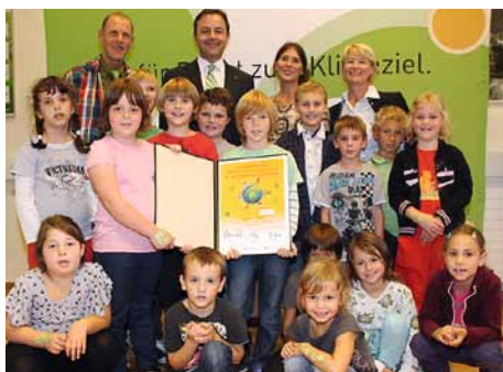
Die Gartendorfschule Schiltern wurde von Umweltminister Berlakovich ausgezeichnet.