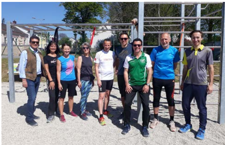
Politik und Sport freuen sich über das neue Angebot für unsere Bevölkerung.

jedermann und kostenlos nutzbar können Kräftigungs- und Koordinationsübungen durchgeführt werden. Nachdem Bewegungsstationen in der Lange Sonne und