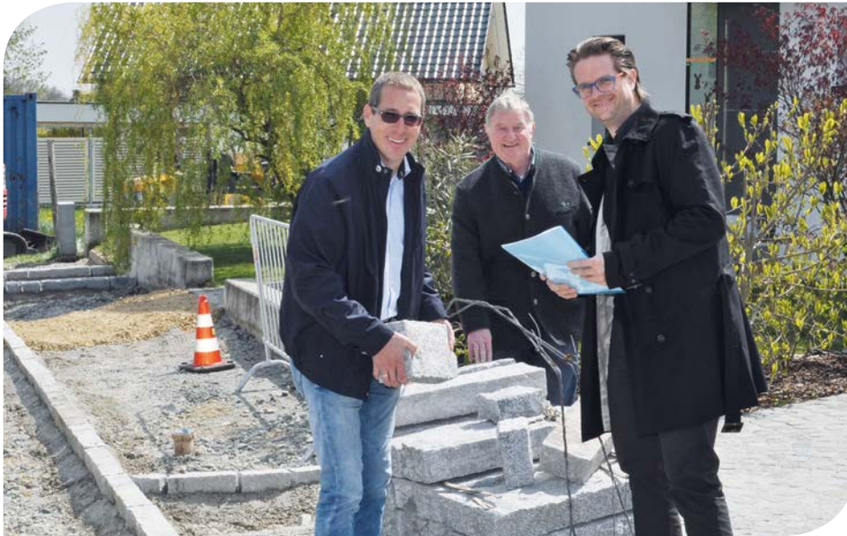
Baustellenbesichtigung in der Eichelbergstraße in Zöbing.

Neubauten, Sanierungen und Kleinmaßnahmen werden in Angriff genommen.