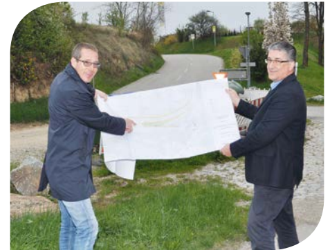
Die Westzufahrt in das Siedlungsgebiet Lange Sonne wird heuer in Angriff genommen.

die geplante zusätzliche Abbiegespur im Bereich Ausfahrt Holzplatz vor der Apotheke sollen den kontinuierlichen Verkehrsfluss in der Stadt maßgeblich verbessern. Aufgrund des hohen Verkehrsaufkommens und des gleichzeitig sehr schlechten Straßenzustandes ist