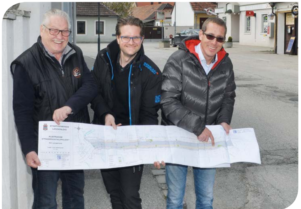
Die Austraße wird zwischen der Zwoni-Kurve und der Umfahungsstraße saniert.