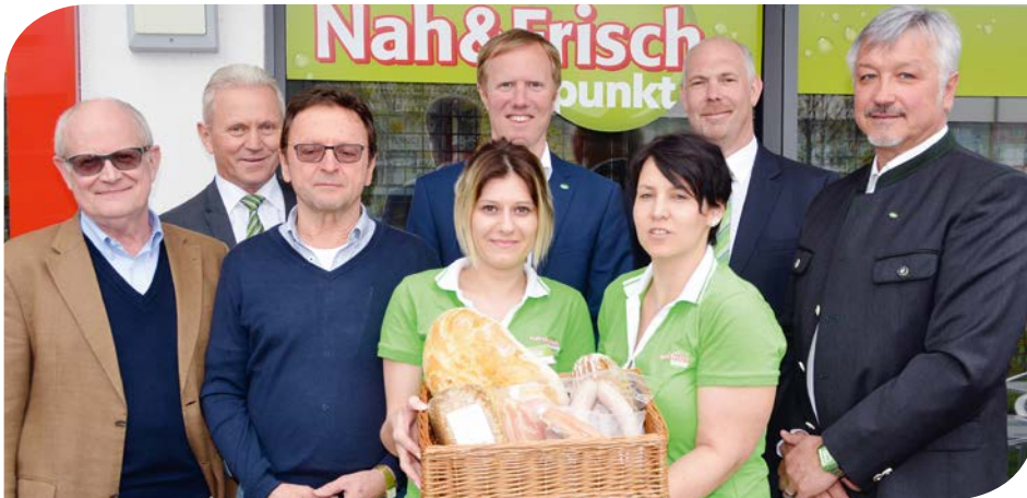
Ein tolles Team bietet in der Greißlerei und im Café eine verbesserte Nahversorgung in der Langen Sonne.

Weiteres Anliegen der Bevölkerung realisiert.