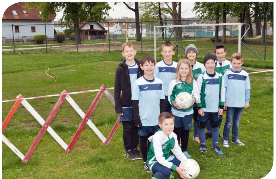
Die Jugendmannschaft U9 des USV Langenlois freut sich schon auf das neue Grün im Spitzpark.