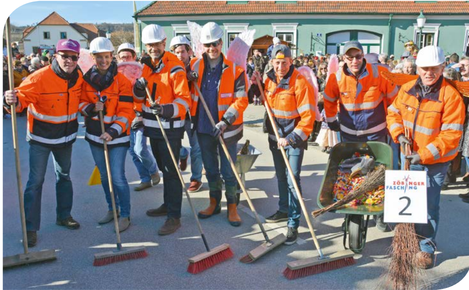
Die ÖVP-Gemeinderäte waren wieder beim Zöbinger Faschingsumzug dabei.